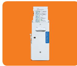
Kit Pass Program (en option)

Une chaleur douce pour un prix accessible.