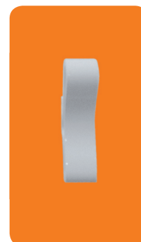
2 patères incluses