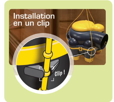
Système d'accroche rapide

IDÉAL POUR : 1 cuisine et jusqu'à 6 sanitaires